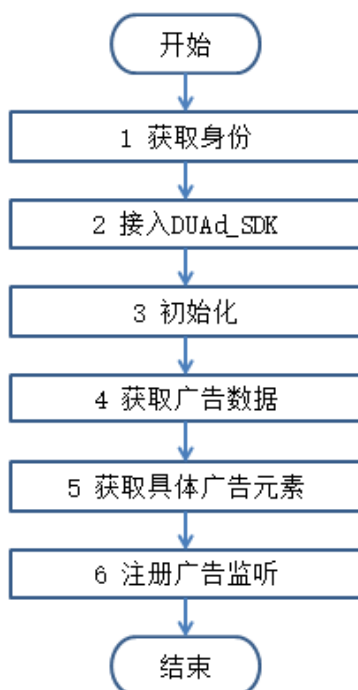
表 1 DU Ad Platform_SDK 的接入流程